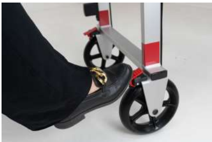
Système de verrouillage des roues fixes 1.º – Activez le système rouge avec le pied pour verrouiller les roues.