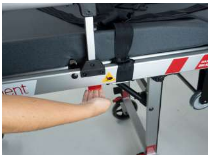
1.º – Soulevez le levier (situé sur le côté droit du chariot).