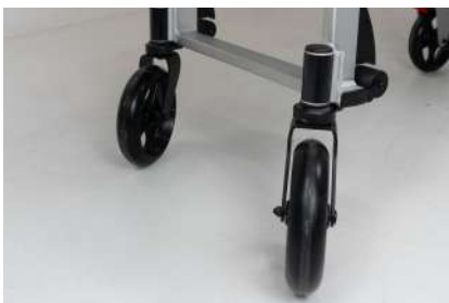
2 roues pivotantes