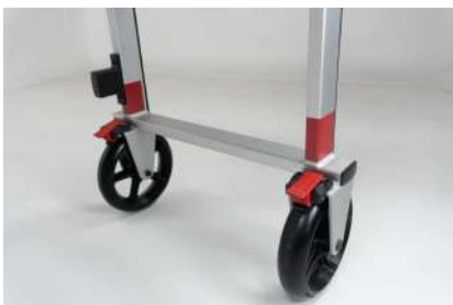
2 roues fixes